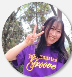
障がい福祉係長（入職3年目）

社協に入って一番驚いたことは、「普通に褒めてもらえる」ことです。良し悪しも含めしっかり丁寧に教えてもらえるので、自分の成長を日々実感することができています。