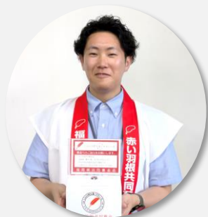
総務係職員（入職3年目）

社協に入って一番驚いたことは、「普通に褒めてもらえる」ことです。良し悪しも含めしっかり丁寧に教えてもらえるので、自分の成長を日々実感することができています。