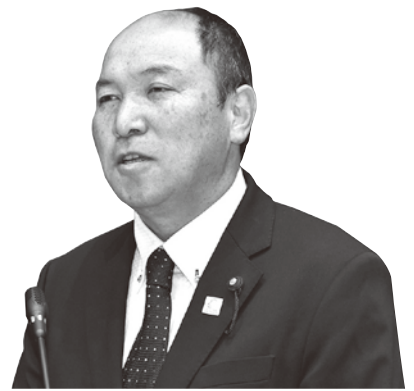
とくなが たくや 徳永 卓也 議員