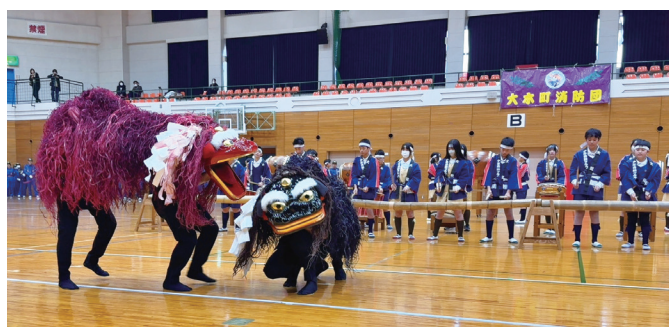
▲大莞若獅子まとい太鼓と獅子舞

新春恒例の令和8年大木町消防出初式が1月11日に行われました。消防団員、消防関係職員などが参加し、式典では来賓による祝辞や消防功労者に対する表彰が行われました。 また、式典のアトラクションでは大木中学校吹奏楽部による演奏や、大莞少年消防クラブによる大莞若獅子まとい太鼓、上牟田口獅子舞保存会による獅子舞、第3分団（大莞校区）による大木町消防団伝統の「馬簾廻し」が催され、規律厳正な中、盛大に行われました。