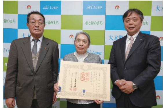
▲左から浦田保護司、田中保護司、広松町長