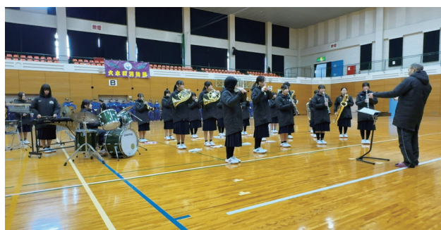
▲大木中吹奏楽部による演奏