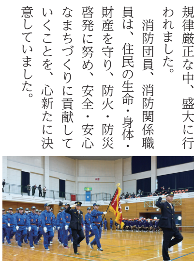
▲第1分団（木佐木校区）の分列行進

新春恒例の令和8年大木町消防出初式が1月11日に行われました。消防団員、消防関係職員などが参加し、式典では来賓による祝辞や消防功労者に対する表彰が行われました。 また、式典のアトラクションでは大木中学校吹奏楽部による演奏や、大莞少年消防クラブによる大莞若獅子まとい太鼓、上牟田口獅子舞保存会による獅子舞、第3分団（大莞校区）による大木町消防団伝統の「馬簾廻し」が催され、規律厳正な中、盛大に行われました。