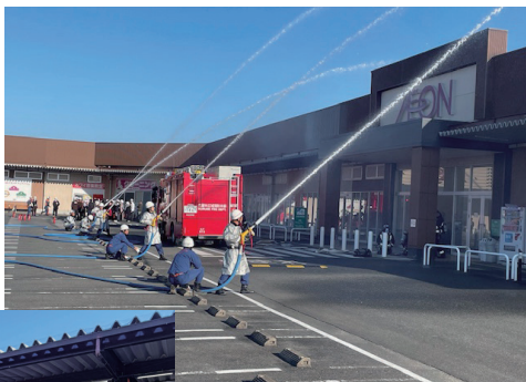
▲店舗への放水訓練 ◀ 消火栓の確認を行う消防団員