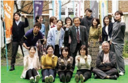
▲大木町社会福祉協議会のみなさん

人口減少社会の中で持続的な活動を行っていくためには、労働環境の改善と労働生産性の向上が必要となっています。