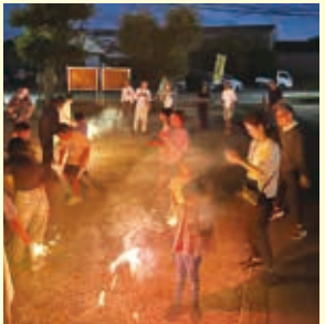
【道本】7月26日 夕涼み会