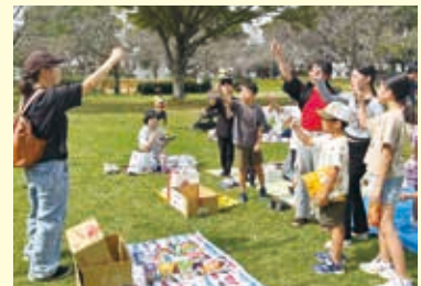
【横溝町】10月19日 石丸山公園遠足