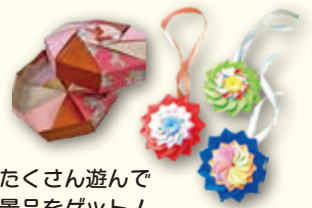
たくさん遊んで 景品をゲット！