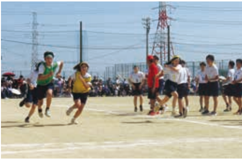
▲3年生の全員リレー