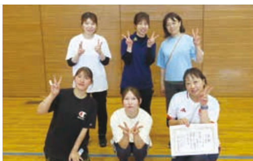
▲3位グループ優勝 チーム古賀