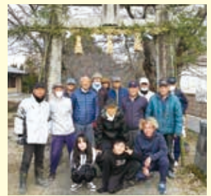
【大敷田中】12月14日 しめ縄作り