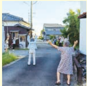
【上木佐木中】7月～8月 早朝ラジオ体操&清掃