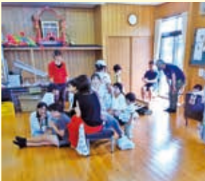
【大角東】8月3日 夏祭り