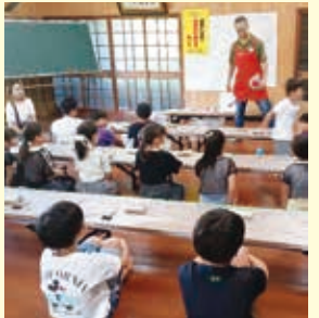
【奥牟田西】7月13日 万華鏡作り