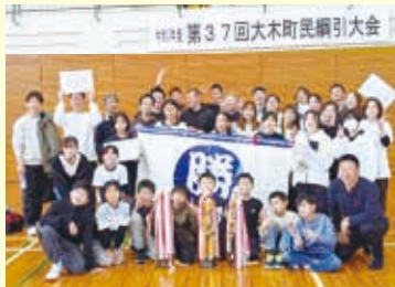
【前牟田東】11月23日 町民綱引き大会