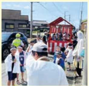
【上牟田口】9月7日 よど祭り