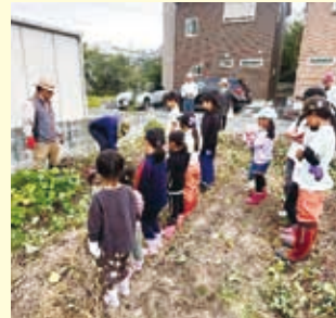
【吉祥】10月25日 さつまいも収穫会