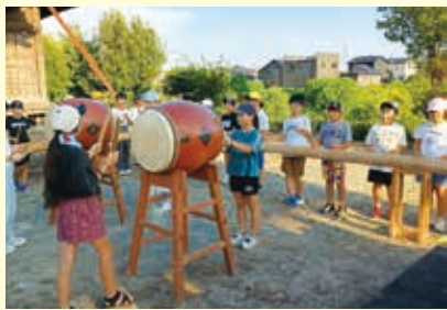
【上八院】8月下旬 よど祭り太鼓練習