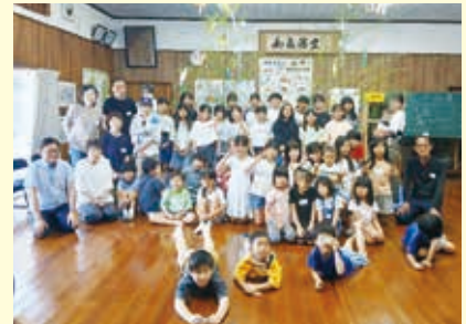
【絵下古賀】7月5日 七夕会