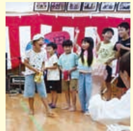
【牟田】8月23日 よど祭り