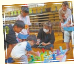
楽しいゲームをたくさん 準備しています！