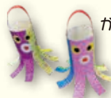
かわいい金魚やタコが泳いでます♪