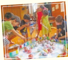
上手に釣れるかな？