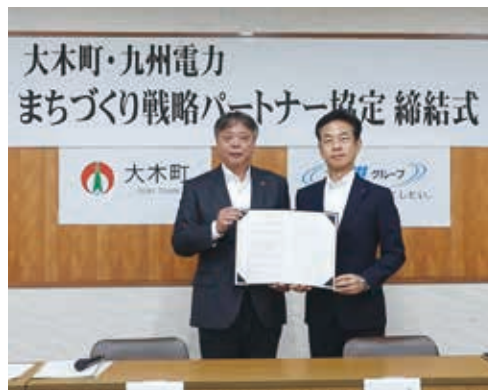
▲九州電力福岡支店の古賀支店長(右)と広松町長