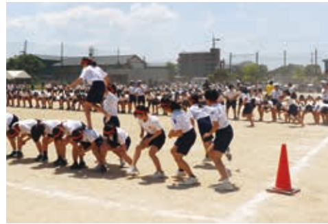
▲ブロック対抗の川下り