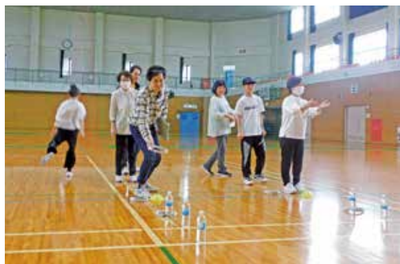
▲スピード輪投げチャレンジ

4月19日、総合体育館で軽スポーツ体験会を行いました。今回は、バスケットピンポン、スピード輪投げチャレンジ、モルック、ダーツの4種類を体験してもらいました。