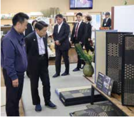
▲(株)イケヒコ・コーポレーションでい製品の見学

その後、道の駅おおきで、きのこのもぎ取り体験や直売所を見学され、最後に、おおき循環センターくるるんで、「住み続けたいと思える持続可能な循環のまち」に向けて町で活躍されている6人の皆さんと意見交換を行いました。