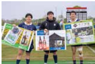
▲大木バイオクリエーションズの地域おこし協力隊の皆さん