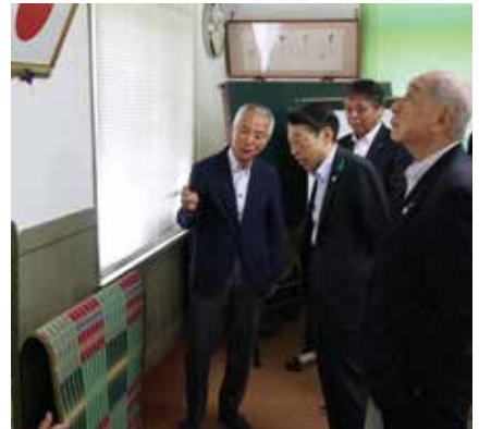
▲福岡県業会館で掛川織の見学