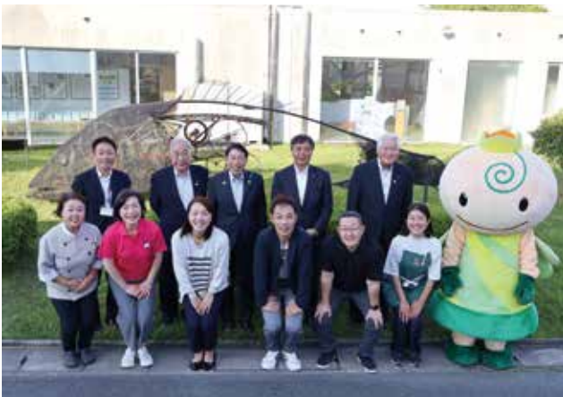
▲おおき循環センターくるるんの前で集合写真