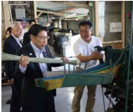
▲(株)イケヒコ・コーポレーションで織機体験