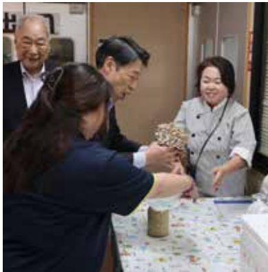
▲道の駅おおきできのこのもぎ取り体験