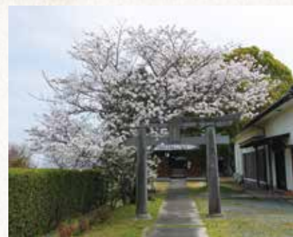
▲桜もきれいな三島神社