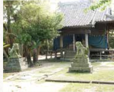
▲落ち着いた雰囲気の内