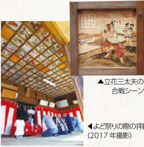
▲立花三太夫の合戦シーン