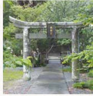
▲鳥居をくぐると楼門、拝殿に