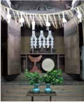
▲本殿の彫刻も見事