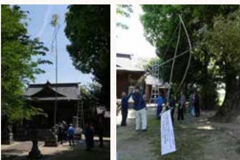
▲社日ご祈禱。旗あげ祈禱は町内では上牟田口と侍島に残っています。（2019年撮影）

神社では今も獅子舞やよど祭りなどの地域行事が盛んに行われていて、普段は静かな境内も行事になるととても賑やかになります。