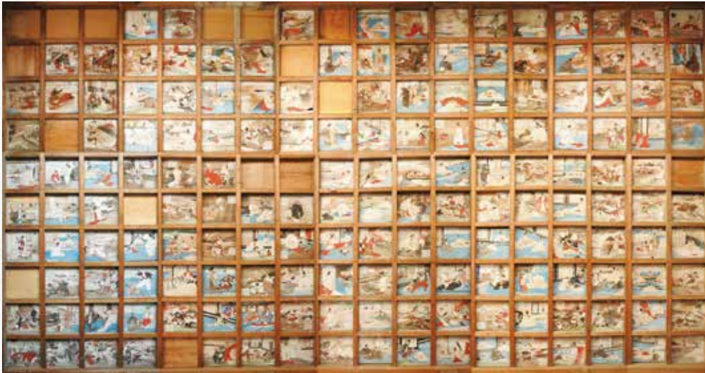
▲現存する天井絵馬 (写真は図書・情報センターで見ることができます。)