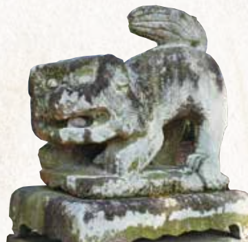
▲愛嬌たっぷりの狛犬