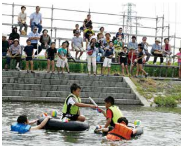
◀大木町商工会青年部が中心になって開催している「堀んびっく」は、堀の町ならではのユニークな競技で盛り上がりします