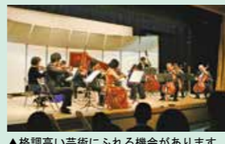
▲格調高い芸術にふれる機会があります