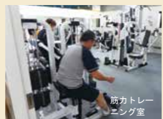
筋力トレーニング室