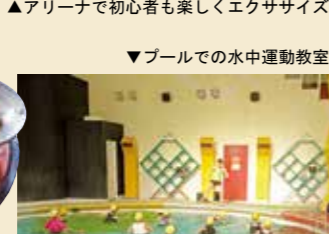
▼プールでの水中運動教室