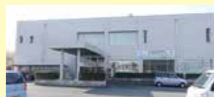
■子育て支援センターにこにこ 10:00～16:00 日・月曜・祝日・年末年始休館

■子育て支援センター「にこにこ」 子育て交流センター1階にある子育て支援センターでは、子育て真っ最中のママやパパが親子で気軽に集まって友だちを作ったりおしゃべりをしたりしてホッと一息つける場です。セミナーや相談会も開催しています。