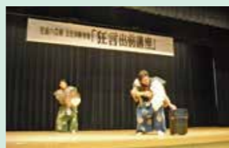
▲小学校と運動した鑑賞事業も実施

いろいろなグループの会合や練習に利用できる会議室、集会室、和室、音楽室を備えた施設です。1階には子育て支援センター「にこにこ」があります。