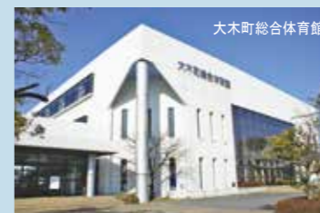
大木町総合体育館

■総合体育館 10:00～22:00 月曜（祝日の際は翌日）・年末年始休館 ■運動公園 8:30～22:00 年末年始休館