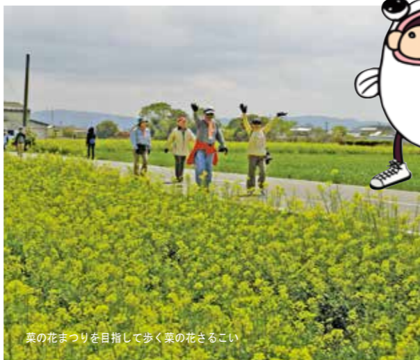
菜の花まつりを目指して歩く菜の花さるこい

「さるこい」はこの地方の方言で「歩きましょう」という意味です。堀と田園風景の中を一日ゆっくり歩き、参加者と地元の人が交流するイベントとして年間に数回行われています。