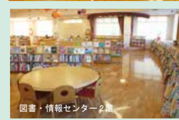
図書・情報センター2階

■図書・情報センター（図書館）10:00～18:00 金曜～20:00 日・祝～18:00 雑誌コーナー～22:00 月曜（祝日の際は翌日）・第3木曜・館内整理日・年末年始休館 ■ホール 9:00～22:00 月曜（祝日の際は翌日）・年末年始休館 ■交流センター（会議室など）9:00～22:00 月曜・年末年始休館