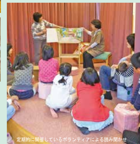
定期的開催しているボランティアによる読み聞かせ

■図書・情報センター（図書館）10:00～18:00 金曜～20:00 日・祝～18:00 雑誌コーナー～22:00 月曜（祝日の際は翌日）・第3木曜・館内整理日・年末年始休館 ■ホール 9:00～22:00 月曜（祝日の際は翌日）・年末年始休館 ■交流センター（会議室など）9:00～22:00 月曜・年末年始休館