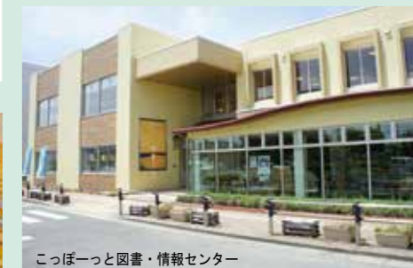
こっぼ一つと図書・情報センター