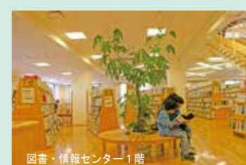
図書・情報センター1階