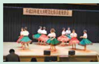
▲日頃の練習の発表の場を提供しています