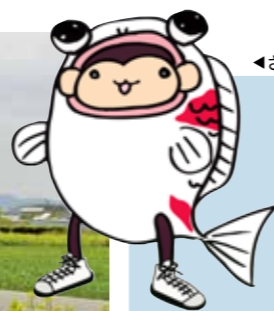
◀さるこいのキャラクター「さるこいちゃん」

「さるこい」はこの地方の方言で「歩きましょう」という意味です。堀と田園風景の中を一日ゆっくり歩き、参加者と地元の人が交流するイベントとして年間に数回行われています。