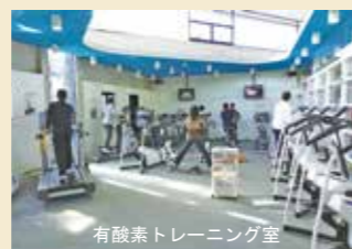
有酸素トレーニング室