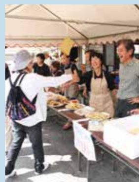
▲地元と参加者との交流が「さるこい」の楽しみでもあります

大木町には各行政区に公民館があり、地域の自主的な活動の拠点になっています。それぞれ祭りやイベントを企画して実施し、地域のつながりを深めています。また、地域では、シルバー人材センターやボランティアのみなさんが、それぞれの経験や特技を生かして活躍しています。そのほか、町内の運動施設では、幅広い年代の方々のはつらつとした毎日を楽しんでいます。