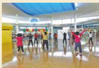
▲アリーナで初心者も楽しくエクササイズ