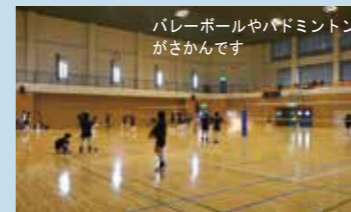
バレーボールやバドミントンがさかんです