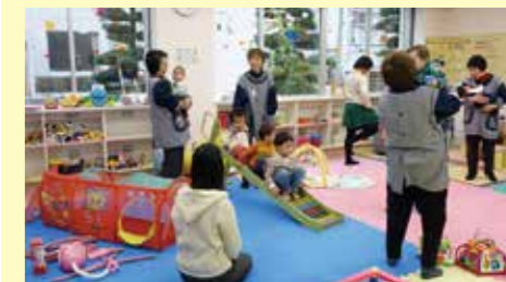
▲ボランティアによる子育て支援