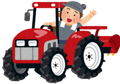
農作業をしながら