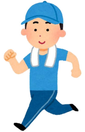
ジョギングしながら