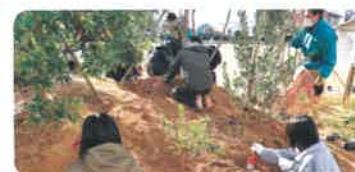
学校緑化(久留米市) 校庭の緑化