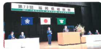
イベント(糟屋郡篠栗町) 第73回福岡県植樹祭