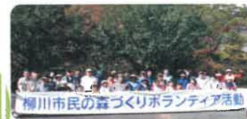
森林整備(八女市) 柳川市民の森での下草刈り