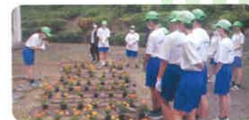
緑の少年団(豊前市) 花いっぱい運動

緑の募金は「緑の募金による森林整備等の推進に関する法律」 に基づき(公財)福岡県水源の森基金が福岡県知事の 指定を受けて行っています。