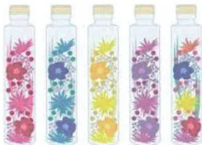
ものづくり ハーバリウム