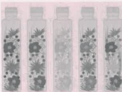
ものづくり ハーバリウム