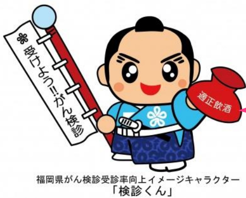
福岡県がん検診受診率向上イメージキャラクター「検診くん」