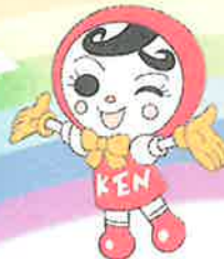
人権イメージキャラクター 人KEN あゆみちゃん