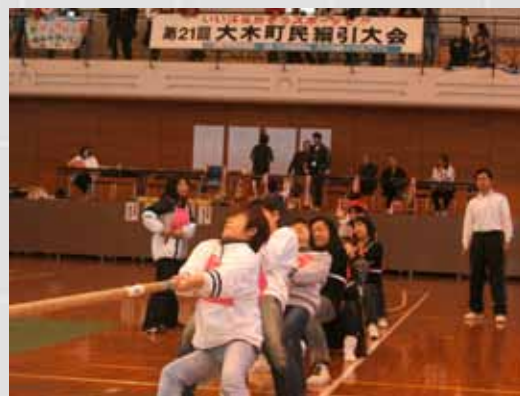
大木町民綱引大会