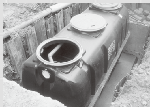
合併処理浄化槽設置工事