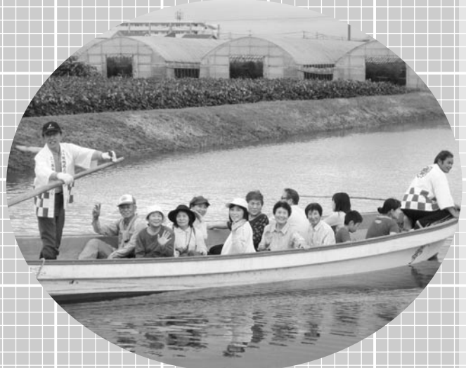
さるこいフェスタ「舟遊び」の風景