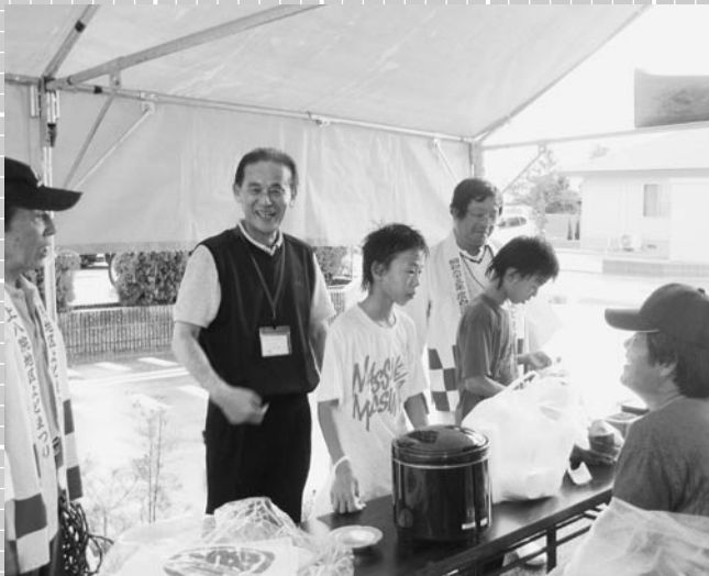
町長自ら各地区を表敬訪問しているようす