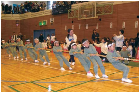
綱引きをする園児