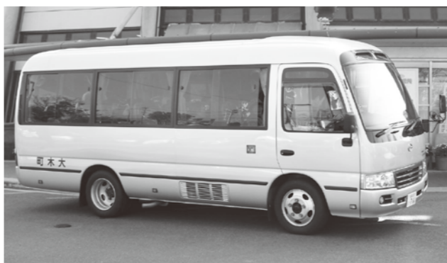
各地域を月に2回巡回しているバス

町長は平坦かつ比較的狭小な地形の中にスーパーや個人商店、医療機関が町内各地区に分散して所在していることや、買い物困難者に対する別の支援措置として、介護保険等において、ホームヘルパーが代行して買い物をを行うサービスが講じ