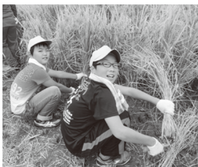
学童農園での稲刈り

教育長 6年生の児童の感想を紹介すると、「自分たちで育てた野菜が入った雑煮はとておいしくできました。本当によかったと思います。たくさんボランティアの方、先生方、保護者の皆さん、ありがとうございました。」このように、子供たちは地域の皆さんに感謝しながら、食の大切さや農作業の大変さ、農業の重要性を感じたと