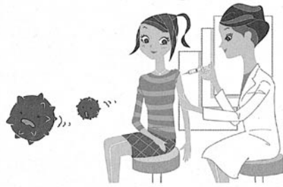
1) 社団法人 日本産婦人科医会、子宮頸がん予防ワクチン(HPVワクチン)接種の手引き [平成22年3月]

A 子宮けいがん予防ワクチンの接種対象は10歳以上の女性です。性交渉を開始する前の年齢で接種するのが最も効果的であると考えられますが、発がん性HPVに感染したとしても多くの場合は免疫により排除されるため、次の感染予防という点から、成人女性でも接種意義は十分あると考えられます。特に、45歳までに接種することが推奨されています 1) 。