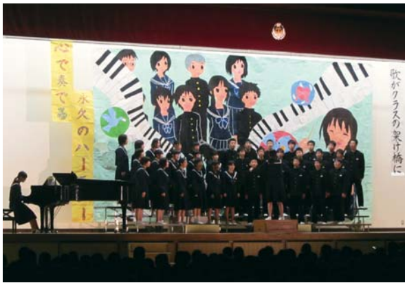
大木中合唱コンクール