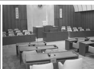
傍聴席から見た議場