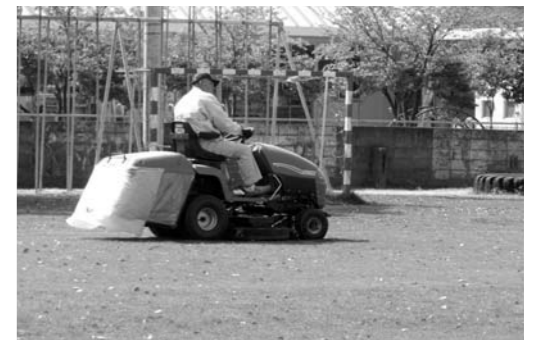
シルバーによる大莞小芝生の管理