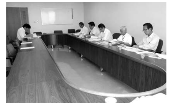
環境課との勉強会