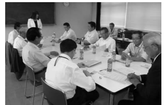
シルバー人材センターとの懇談会

高齢者もいきいきと社会参加できる機会をつくる ため、委員会としても引き続き意見の交換を深めます。