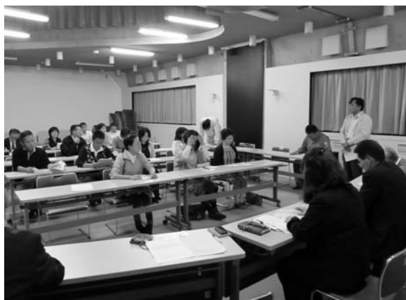
福祉棟で行われた懇談会の様子

10月5日 大木町健康福祉センター視聴覚室 で昨年に引き続き懇談会を開催しました。 各小中学校より今年度の活動状況が紹介され た後、児童・生徒の安全・安心の確保について学校 施設の改善、学級編成等の課題について意見交換 を行いました。 各学校共昨年と同様に通学路の安全確保及び プールの改修を要望され特に通学路では大莞校 区の三八松交差点を中心に北、東に延びる通学 路の歩道確保、木佐木校区の442号沿いの歩道 確保等が要望されました。プール改修では更衣室 が使用できない状況にあるので改修の要望・その 他暑さ対策等の要望が出ました。 早期に解決で きる事項、予算 を伴い計画が必 要な事項等様々 な要因がありP TAの皆さんと 今後も懇談を深 めながら計画・ 実行していきたく と思います。