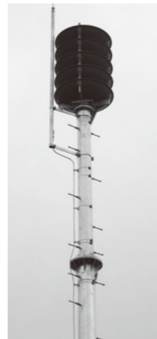
防災行政無線スピーカー (写真はイメージです)