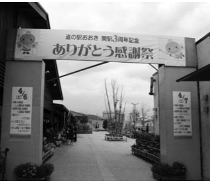
道の駅おおき3周年記念

町長 今年度予算は、積極的で町の色を生かした独自色のある、まちづくりや活性化を図る新規事業が多く、評価できる。しかし、税金が効率よく生かされるのか、無駄にならないのか、真価が問われる。最後は執行残にならないか心配だ。