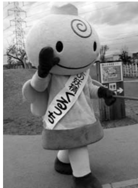
大木町ゆるキャラ「くるっち」

町長 観光振興を図っていくことは、まちの発信力向上にも結びつくものであり、まちの活力を高めていく上での取り組み課題のひとつと認識している。しかし、本町の観光振興を図る上では、道の駅おおきやアクアスといった一定の集客力を有する施設や堀、農業など、観光分野への活用可能性を有する資源はあるが、他の市町村との比較において本町が特段魅力的な観光資源を有しているとは言いがたい。当面の観光振興については、商工会、J.Aとも連携を図りつつ、道の駅、アクアスなどのさらなる活性化や体験型農業の推進など、活用可能性の高い資源を活かした取り組み、久留米広域市町村圏事務組合などを通じた周辺市町村との連携による取り組みを着実に推進していくことが適当と考えている。