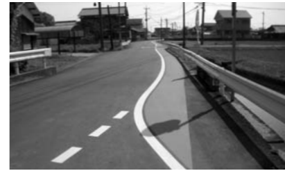
路側帯のカラー舗装

町長 今年度予算は、積極的で町の色を生かした独自色のある、まちづくりや活性化を図る新規事業が多く、評価できる。しかし、税金が効率よく生かされるのか、無駄にならないのか、真価が問われる。最後は執行残にならないか心配だ。