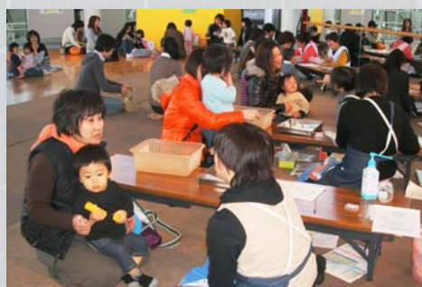
3歳児健診のようす