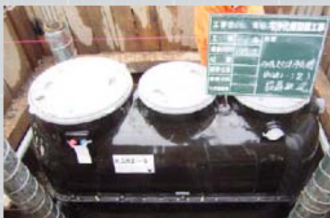
合併処理浄化槽の埋設工事