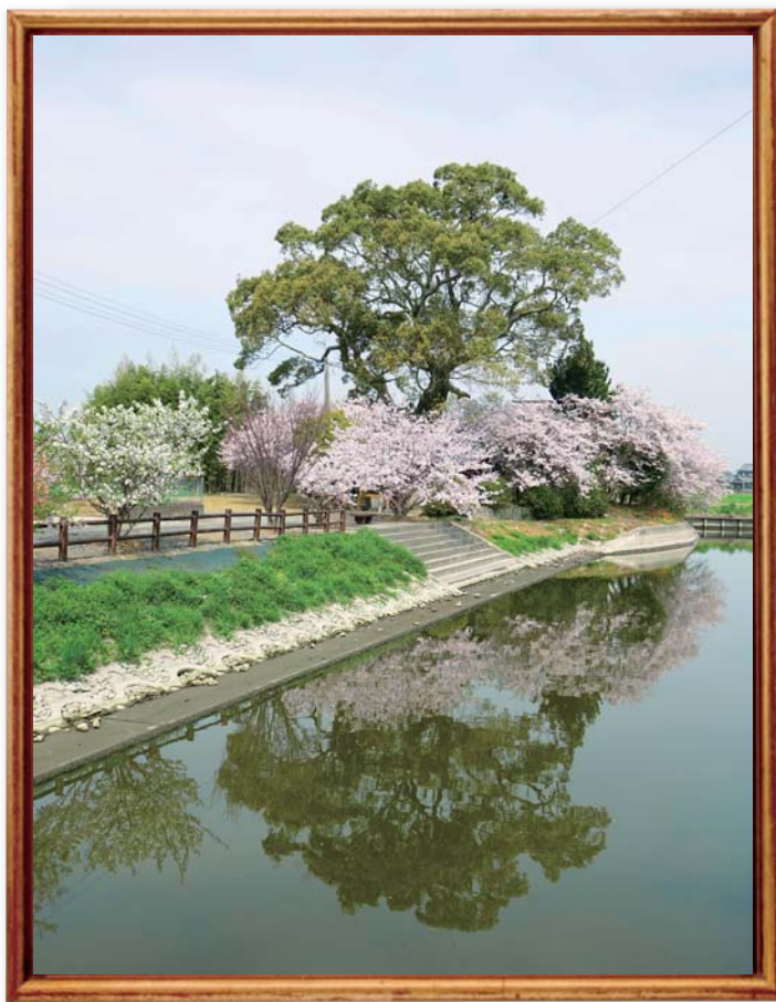
吉祥三島神社の桜 「堀に映るお宮と桜がみごと」