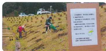
公園などで緑化(田川郡香春町) ダム公園の植栽