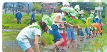
緑の少年団(飯塚市) 地域の人たちとの田植え

緑の募金は「緑の募金による森林整備等の推進に関する法律」に基づき(公財)福岡県水源の森基金が福岡県知事の指定を受けて行っています。