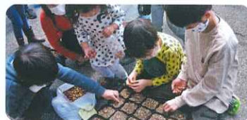
体験学習(久留米市) どんぐりの植え