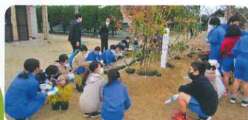
学校緑化(古賀市) 中庭の植樹