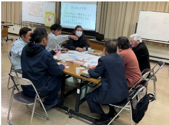
まちづくり団体との意見交換会