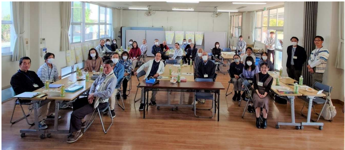
校区づくり検討会に参加した皆さん(大莞コミュニティセンター)