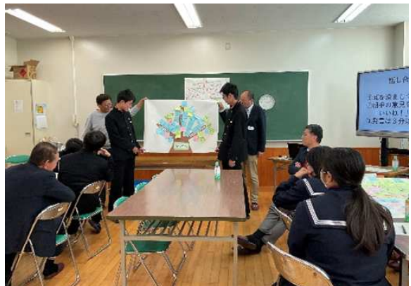
大木中学校の生徒との意見交換会