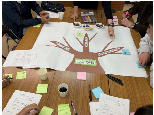
「つながる」の木にアイデアの葉を